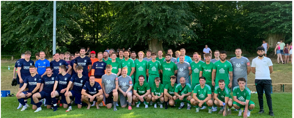
Foto: Mannschaft ESV