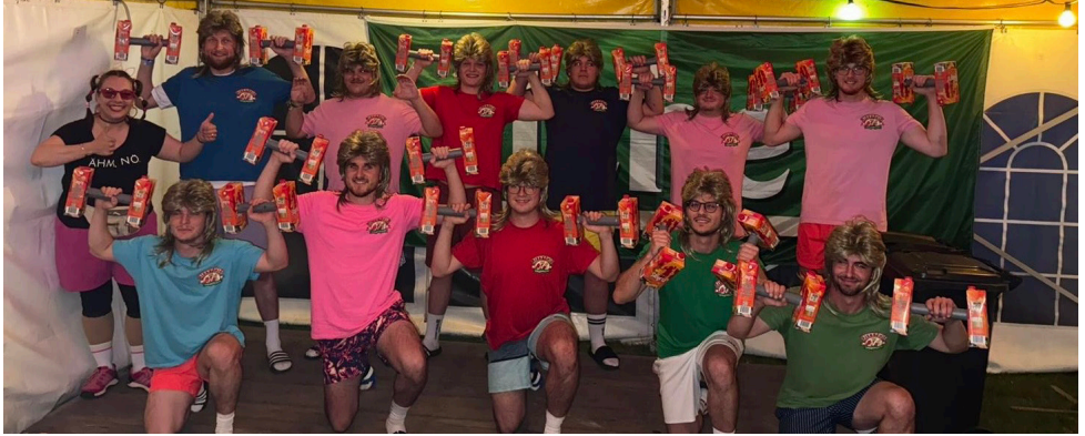
Wie immer ein sehenswerter Auftritt und Höhepunkt am Heimatabend der diesjährigen Kirmes. Unsere „Malle Jungs“ vom ESV.