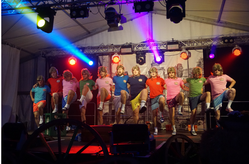
Unsere „Malle Jungs“ am Heimatabend in Action.