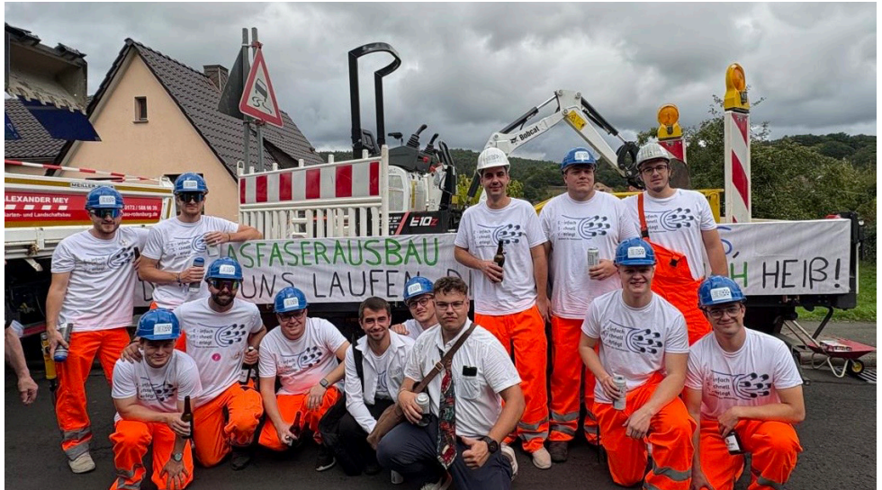
Der Glasfaserausbau in Ronshausen läßt schon lange auf sich warten. Die „Kirmes Jungs“ vom ESV würden da schnell helfen können nach dem Motto: „Einfach Schnell Verlegt“