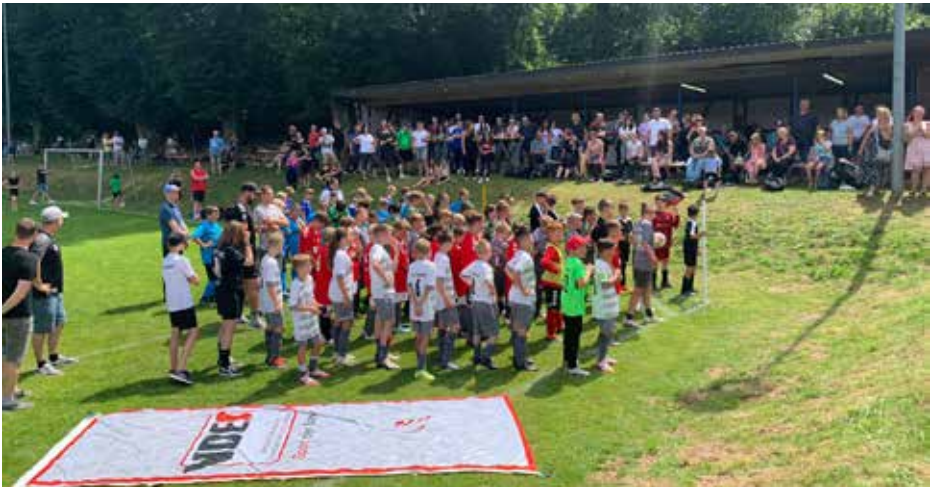
Viel los war auf der diesjährigen Sportwoche des ESV Ronshausen wie hier bei einem Jugendspiel des JFV Ulfetal.