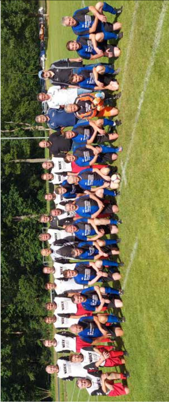
Aufstellung vor dem Spiel auf unserer Sportwoche am Samstag den 13.7.2024 zwischen einer Auswahl der Alten Herren des ESV Ronshausen und einer VDES-Auswahl.