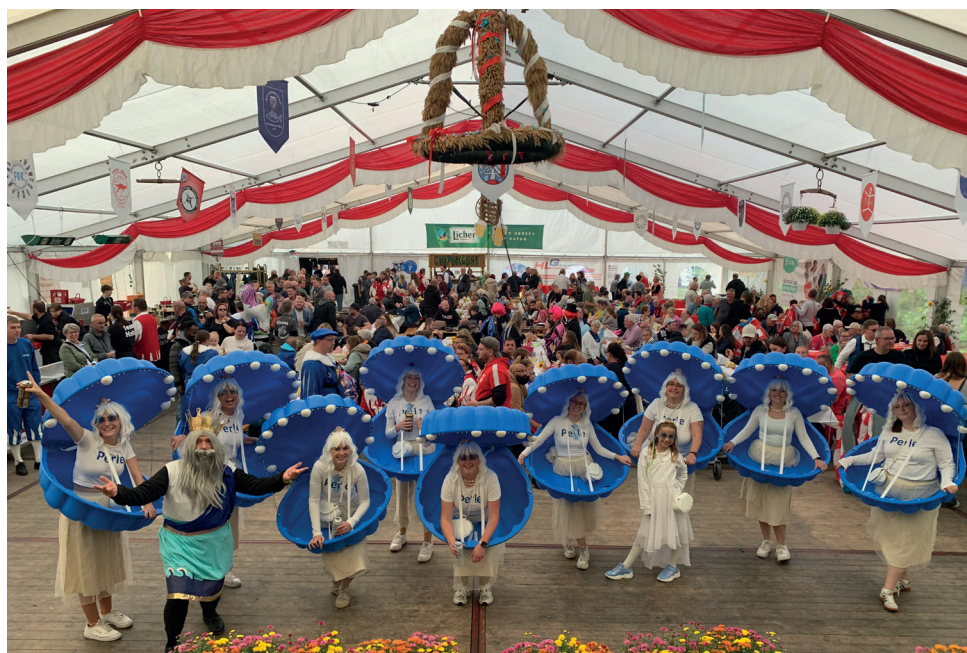
Die Ulfepferlen bei einem Spontanauftritt am Kirmessonntag im gut gefüllten Festzelt mit ihren tollen Muschelkostümen. :)