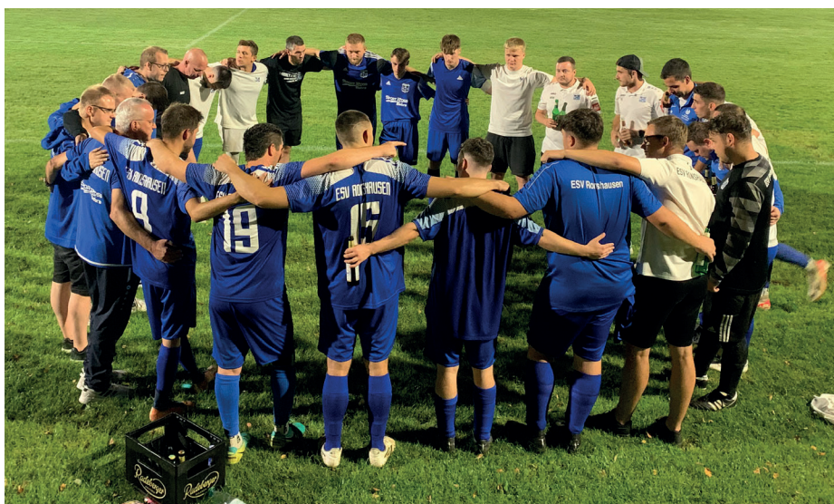
Der Spielerkreis oder besser gesagt der Siegerkreis nach dem Spiel gegen die SG Sorga/Kathus am 06.9.2024, das im Abendspiel mit 5:1 gewonnen werden konnte.