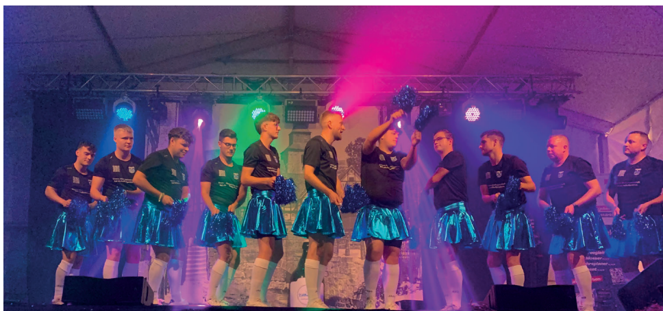
Wenn Männer in Röckchen tanzen kommt das immer gut an, vor allem bei der sympathischen Fußballertruppe am Heimatabend.