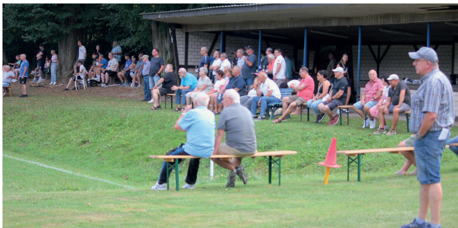
Auch wenn der Start in die A-Klasse etwas holprig war, kommen wieder zahlreiche Zuschauer so wie hier am 08.9.2024, um den ESV Ronshausen zu sehen.