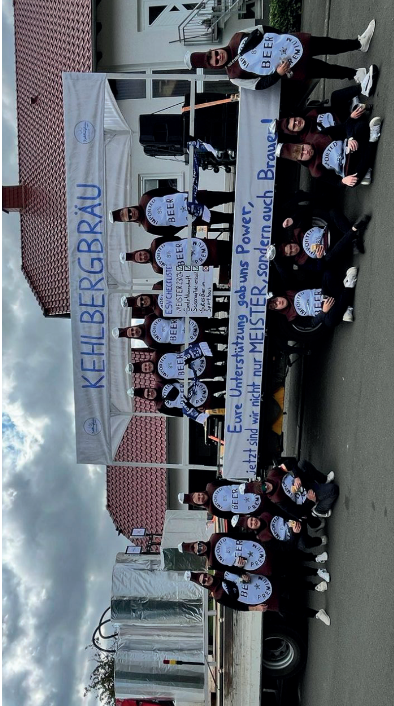
Zum Glück spielen sie trotz ihrer neuen Tätigkeit als Brauer noch weiterhin Fußball. Beim Umzug haben sie zumindest mit ihrem Outfit als Bierflaschen begeistert: Die Jungs vom ESV. :)