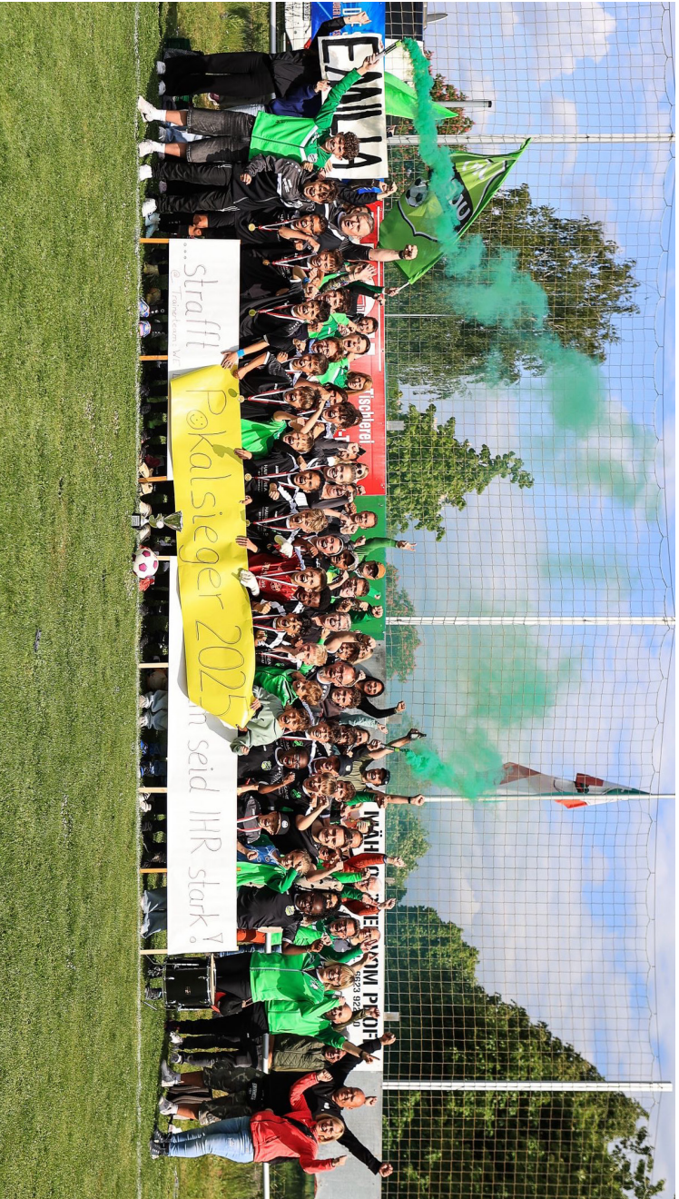
Nach dem Sieg über die JSG Alheim konnten Mannschaft, Trainer und Betreuer, Eltern, Vorstand und viele Fans gemeinsam feiern.