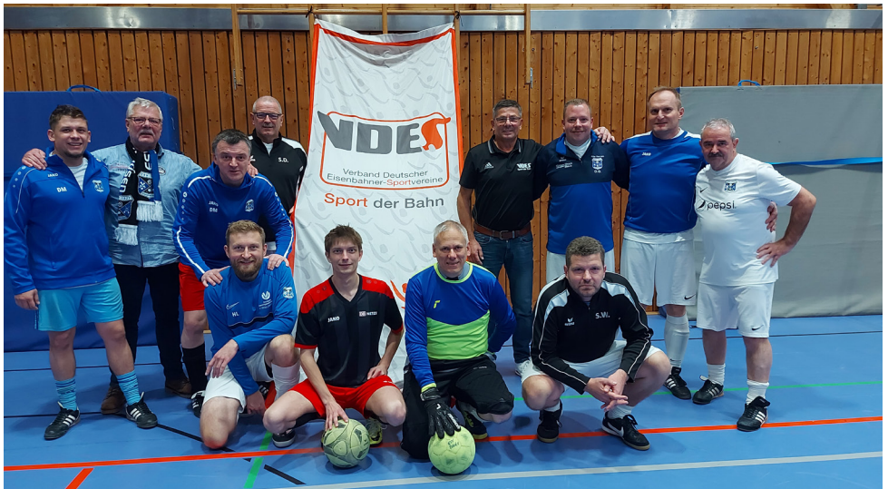
Das Team des ESV Ronshausen bei der VDES Hallenregionalmeisterschaft 2024 beim ESV Fulda.

Vor diesen interessanten Turnieren steigt die VDES Bergwanderwoche in Garmisch-Partenkirchen vom 21.- 24. Juni. Die Hallenregionalmeisterschaft richtet am 15. November der ESV Hönebach in Wildeck-Obersuhl aus.